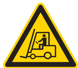
Let op: Heftrucks