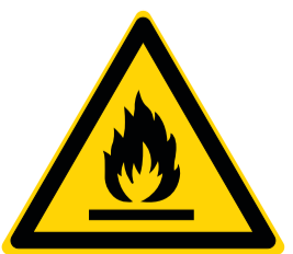
Let op: brandbare materialen