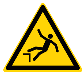
Let op: Vallen door hoogtevverschil