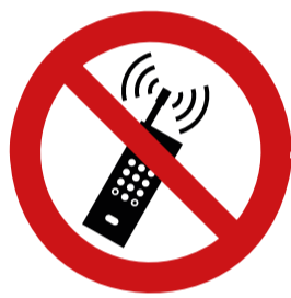
Draagbare telefoon verboden