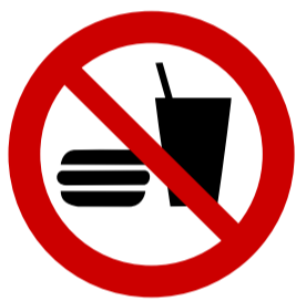
Eten en drinken verboden