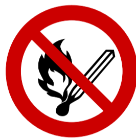
Vuur en open vlam verboden