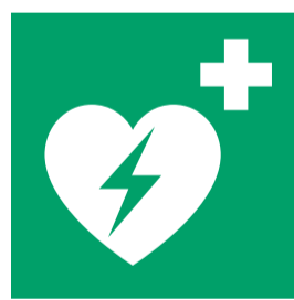
AED in pand aanwezig